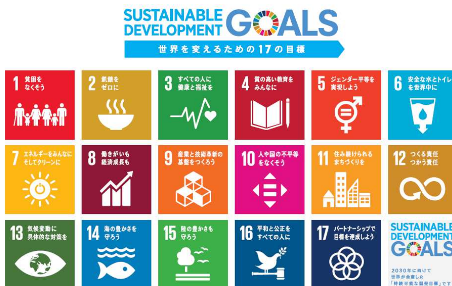
SDGs ロゴ

目標 17 持続可能な開発のための実施手段を強化し、グローバル・パートナーシップを活性化する。