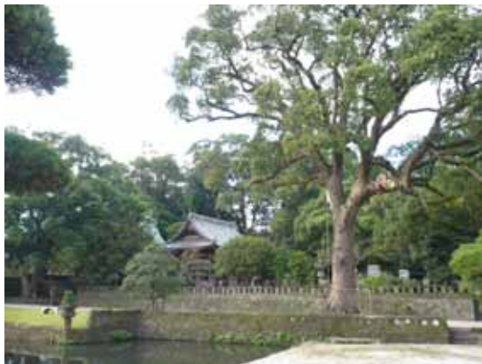
D2 岡山神社の石垣と樹木