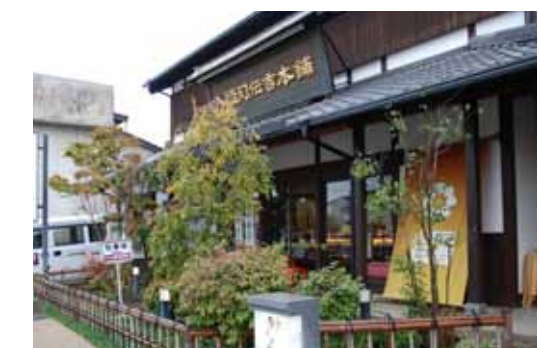
F5 羊薬店 [八頭司伝吉本舗]