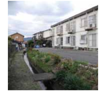
F3 街中の水路と路地