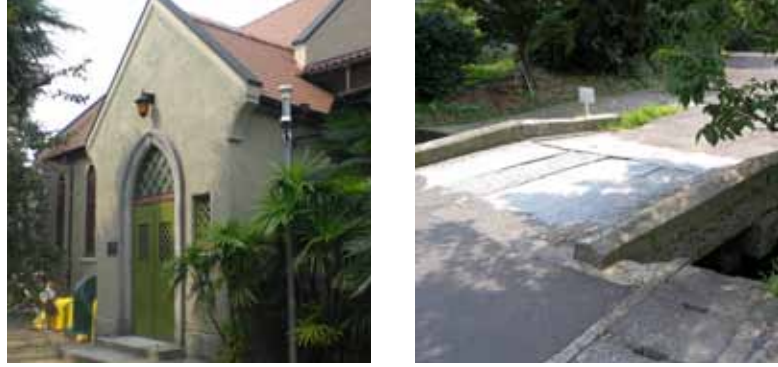
C2 ルーテル小城教会