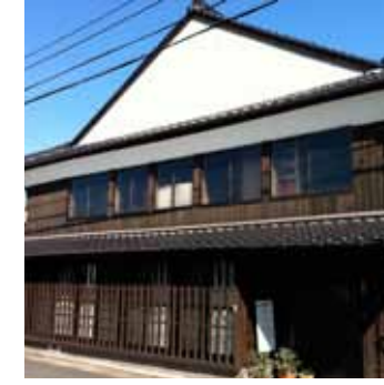
E3 大手町の町家 [岸川家]