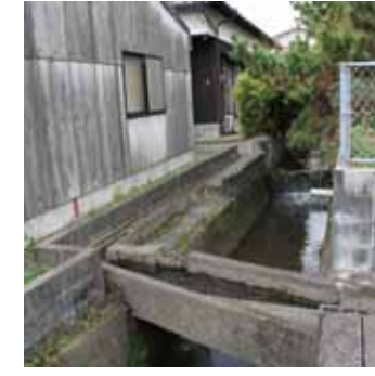
E6 中水路と背割り水路