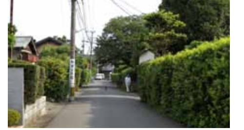
E2 鯖岡小路の町並み