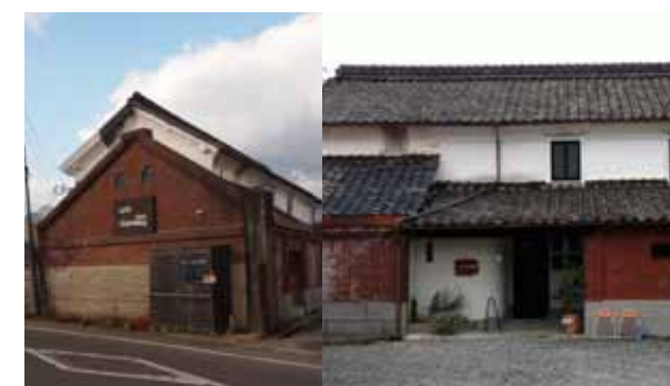
F6 蔵の店 [cafe charmmy]