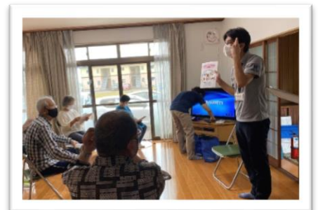
支えあいセンターの紹介