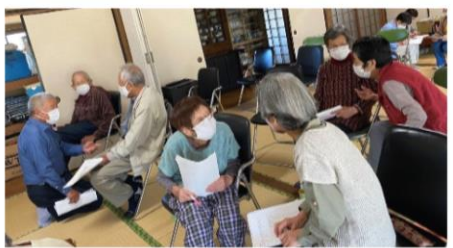
楽しくおしゃべり