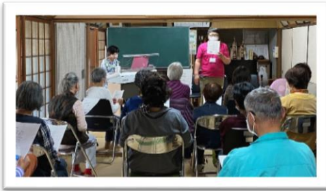
エレクトーン演奏による 歌・健康体操

コロナ禍であっても、感染予防対策をしっかりとしながら、 ムーミンひろば（四条・深町）を開催しました。