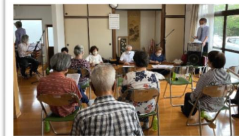
大正琴・ハーモニカ・篠笛演奏