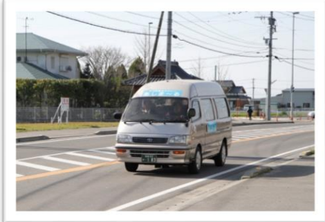
■芦刈町乗合タクシー