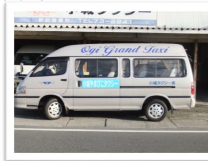
■小城やまびこタクシー