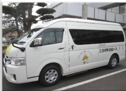
■三日月町巡回バス