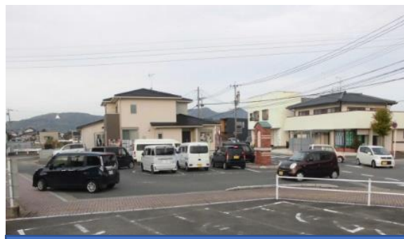
駅前ロータリーの混雑状況