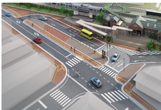
新しい牛津駅前広場イメージ