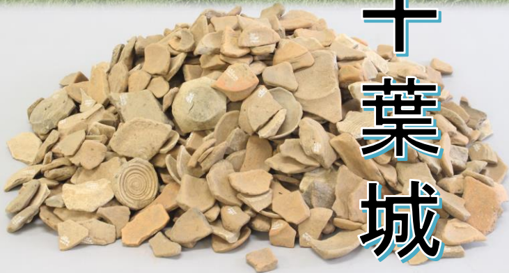
出土した大量のかわらけ