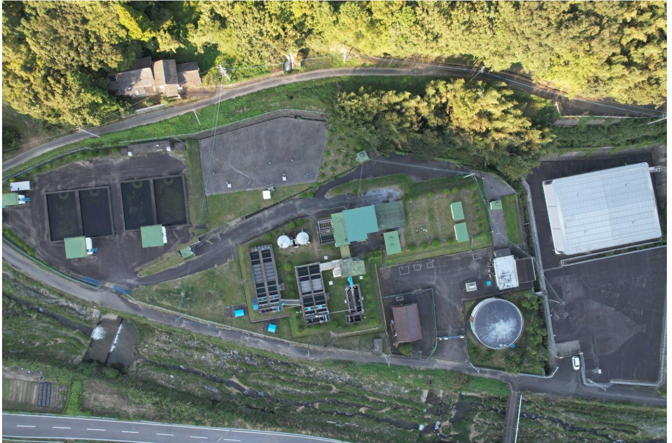
松本浄水場上空写真