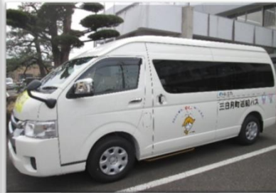
■三日月町巡回バス