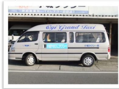
■小域やまびこタクシー