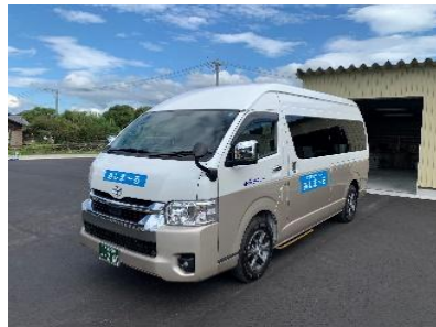
■戸刈町乗合タクシー